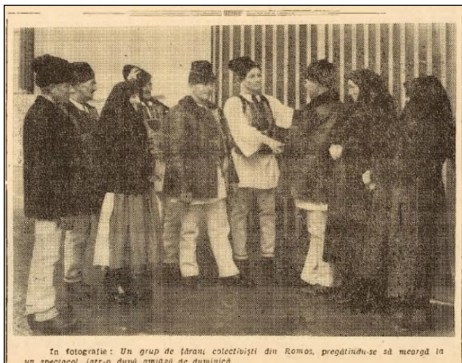
In fotografie: Un grup de țărani colectivști din Romos, pregătindu-se să meargă la un spectacol, într-o după amiază de duminică.

În această direcție, menționăm apariția în nr. 2228 din 23 februarie 1962, pe prima pagină a periodicalului „Drumul socialismului”, a fotografiei redată mai jos ( Fig. nr. 2 ). Aceasta prezintă „un grup de țărani colectivști din Romos, pregătindu-se să meargă la un spectacol, într-o după amiază de duminică” 25 .