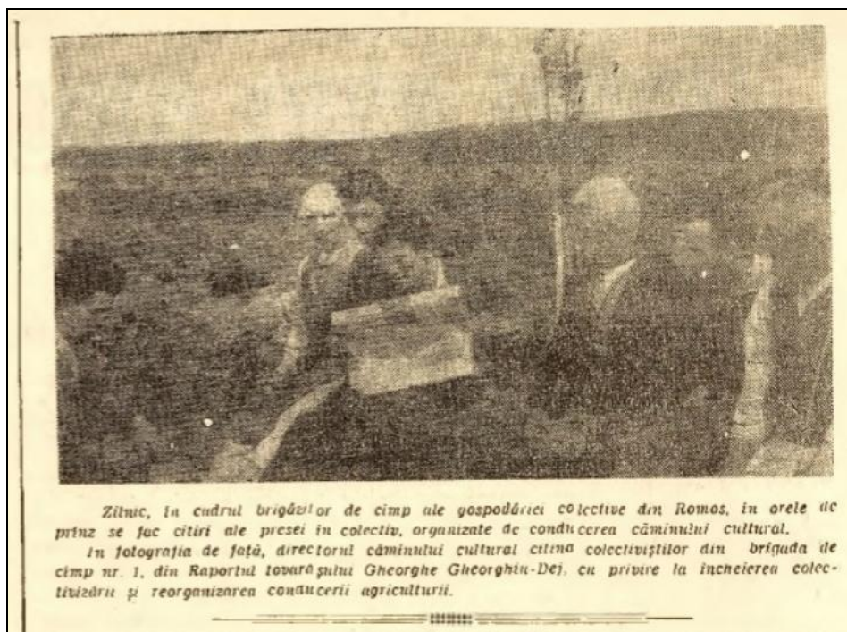
Figura nr. 3: „Zilnic, în cadrul brigăzilor de câmp ale gospodăriei colective din Romos, în orele de prînz se fac citiri ale presei în colectiv, organizate de conducerea căminului cultural”.

La 30 aprilie 1962, același periodic aduce în prima pagină din nr. 2285, o fotografie care informează că „Zilnic, în cadrul brigăzilor de câmp ale gospodăriei colective din Romos, în orele de prînz se fac citiri ale presei în colectiv, organizate de conducerea căminului cultural” 26 . În continuare este explicat că „În fotografia de față, [se găsește] directorul căminului cultural citind colectivștilor din brigada de câmp nr. 1 din Raportul tovarășului Gheorghe Gheorghiu-Dej cu privire la încheierea colectivizării și reorganizarea conducerii partidului” 27 ( Fig. nr. 3 ).