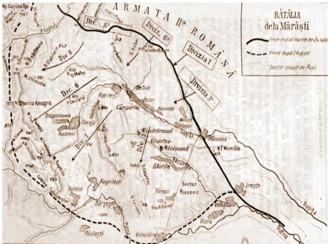
Figura nr. 4. Harta cu înaintarea diviziilor românești în Bătălia de la Mărăști, preluată din sursa

https://upload.wikimedia.org/wikipedia/commons/8/88/1929_Batalia_de_la_Marasti_Kiritescu_II_477.png , accesată în data de 24.04.2022.