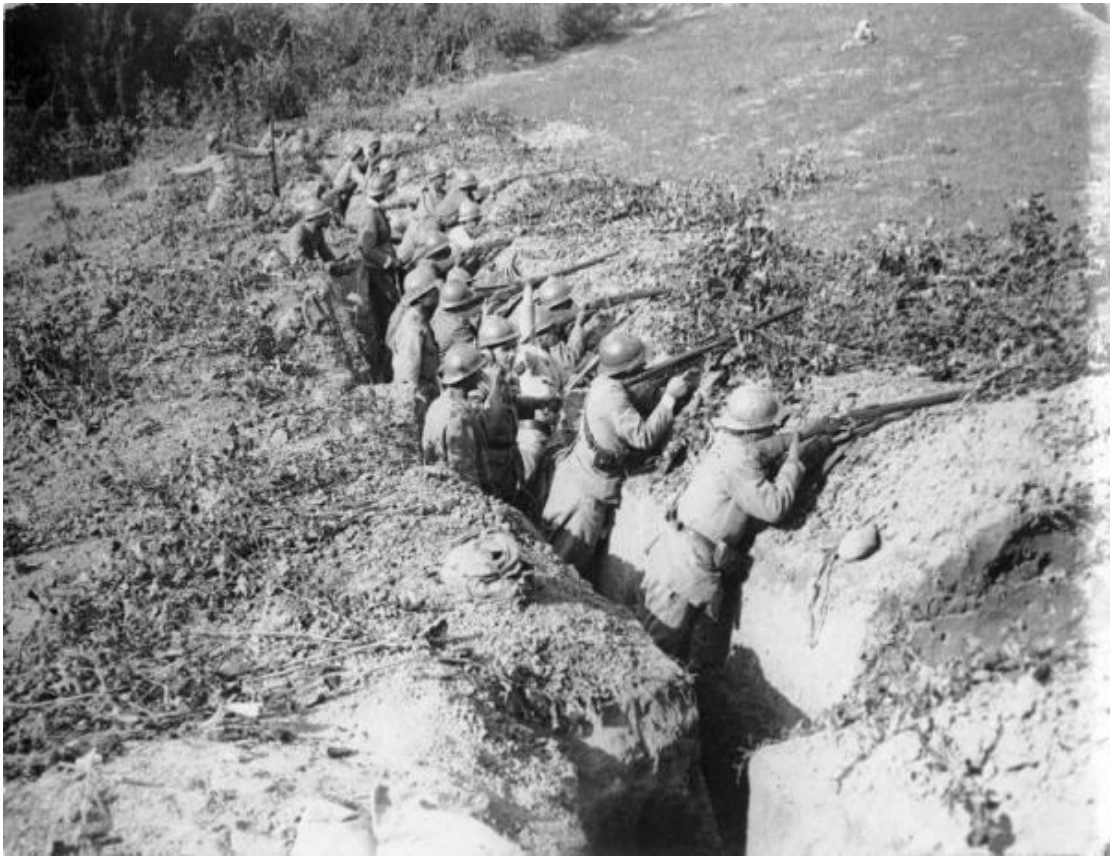
Figura nr. 3. Militari români în ofensiva de la Mărăști, preluată din sursa https://www.unitischimbam.ro/batalia-de-la-marasti/ , acesată în data de 24.04.2022.