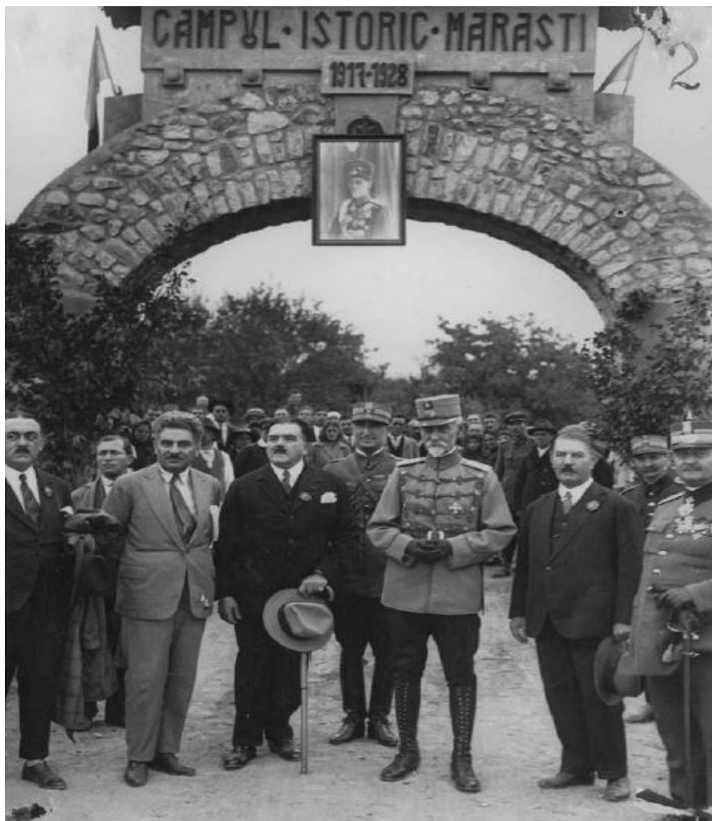
Figura nr. 5. Inaugurarea Câmpului istoric Mărăști