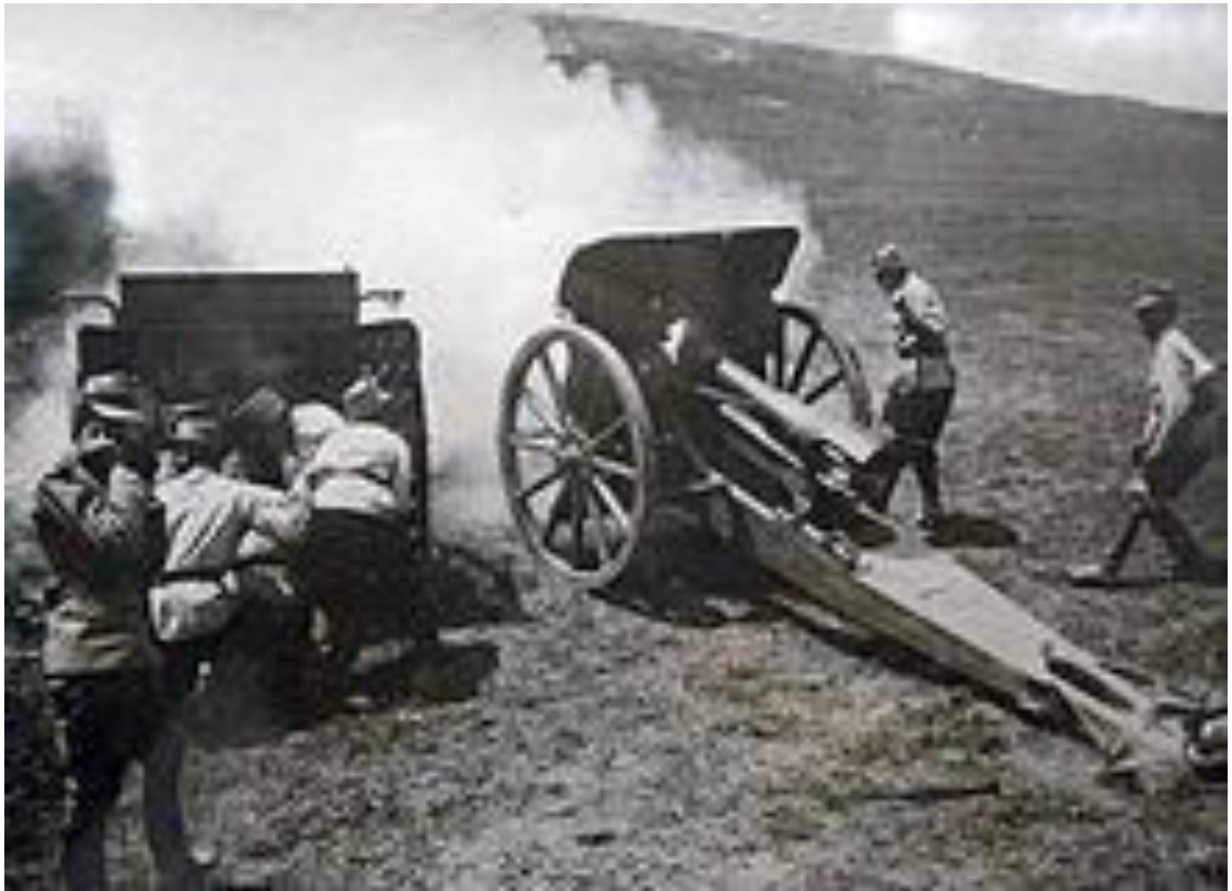
Figura nr. 2. Artileriști români lovind pozițiile inamice, preluată din sursa https://ro.wikipedia.org/wiki/B%C4%83t%C4%83lia_de_la_M%C4%83r%C4%83%C8%99ti#/media/Fi%C8%99ier:CasinValley1917.JPG , acesată în data de 23.04.2022.