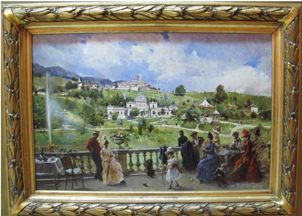
Figura IV – Pe terasă la Sinaia