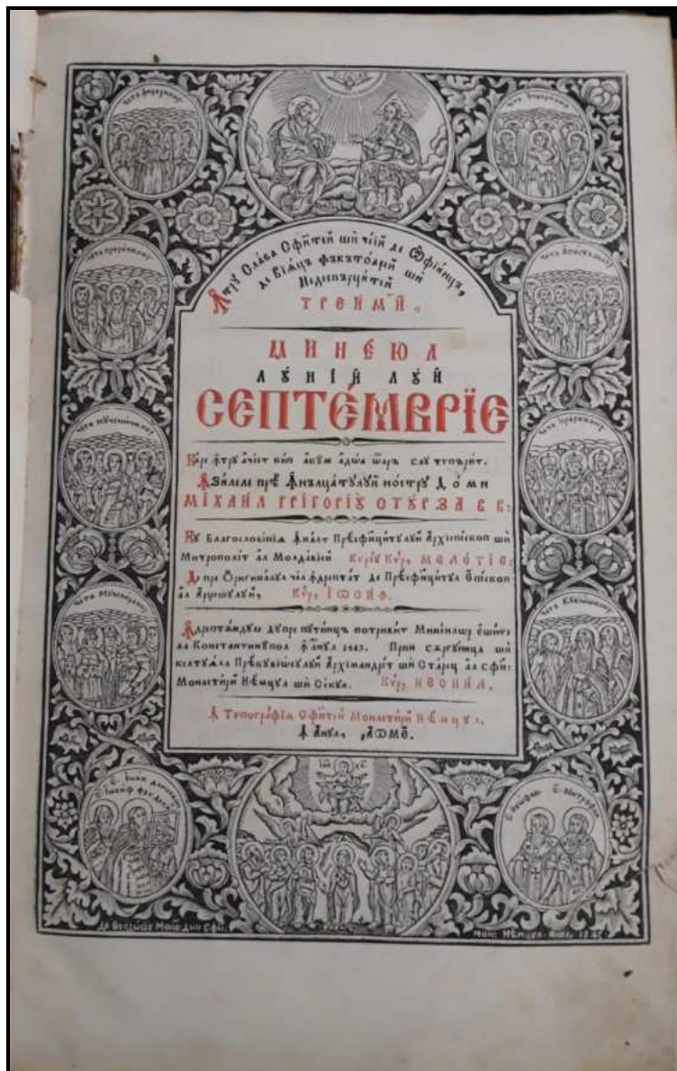
Fig. 1. Foaia de titlu a Mineiului luni septembrie. BMN, nr. inv. 4473, Mineiul lunii septembrie, Mănăstirea Neamț, 1845, foaia de titlu.