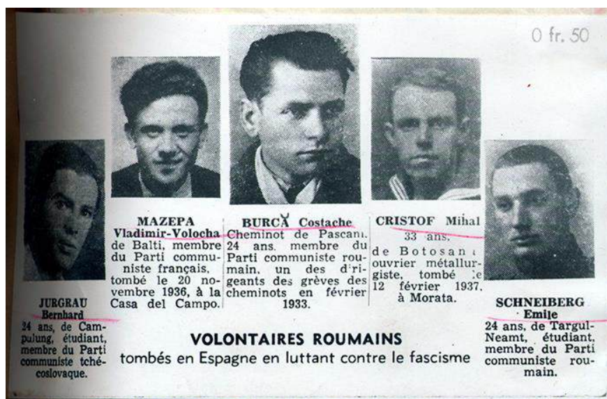
Fig. 1. Voluntari români decedați în Spania republicană.

( https://www.stelian-tanase.ro/romanii-in-razboiul-civil-spania/ , accesat la 20 noiembrie 2024)