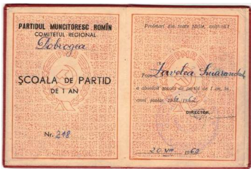
Figura IV – Diploma care atestă faptul că S. Zăvelcă a absolvit o școală de partid – colecția personală;