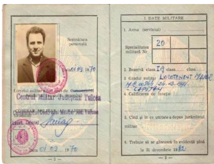
Figura V – Livretul militar al lui S. Zăvelcă –