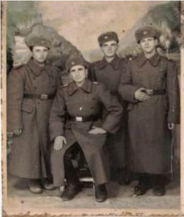
Figura II – bunicul matern împreună cu câțiva camarazi, poză de grup la Ploiești în 1955;